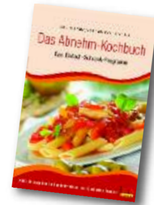
Auszug aus: „Das Abnehm-Kochbuch“, Horn Verlag (ISBN 978-3-9811388-1-8)